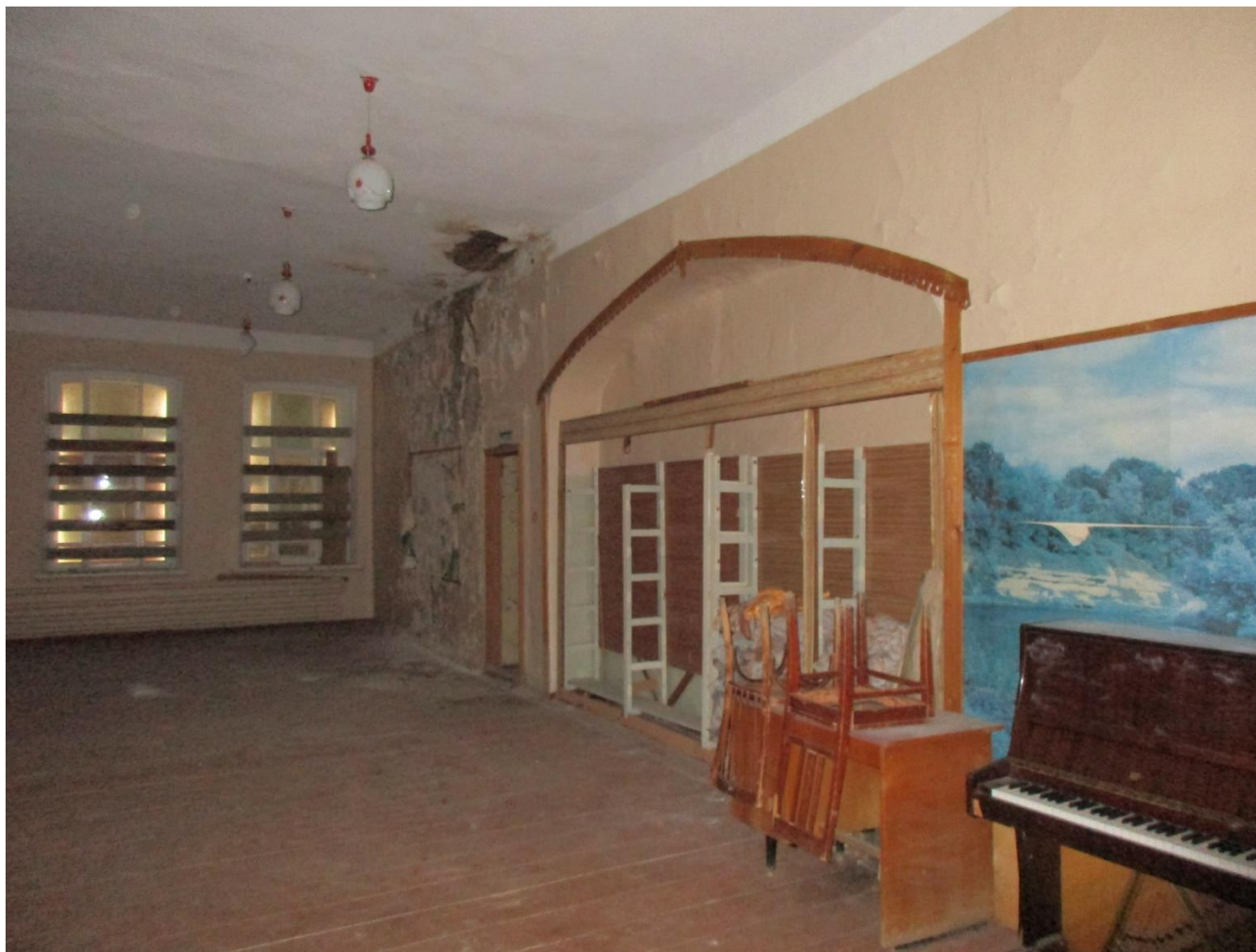
13. Интерьер здания земской школы в Верхнем Тагиле. Рекреационный зал. 16.07.2017