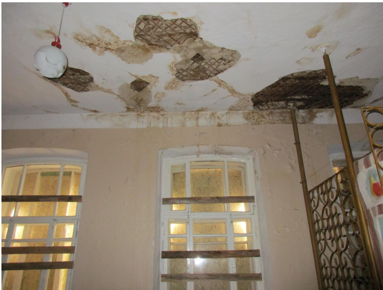
12. Интерьер здания земской школы в Верхнем Тагиле. 16.07.2017