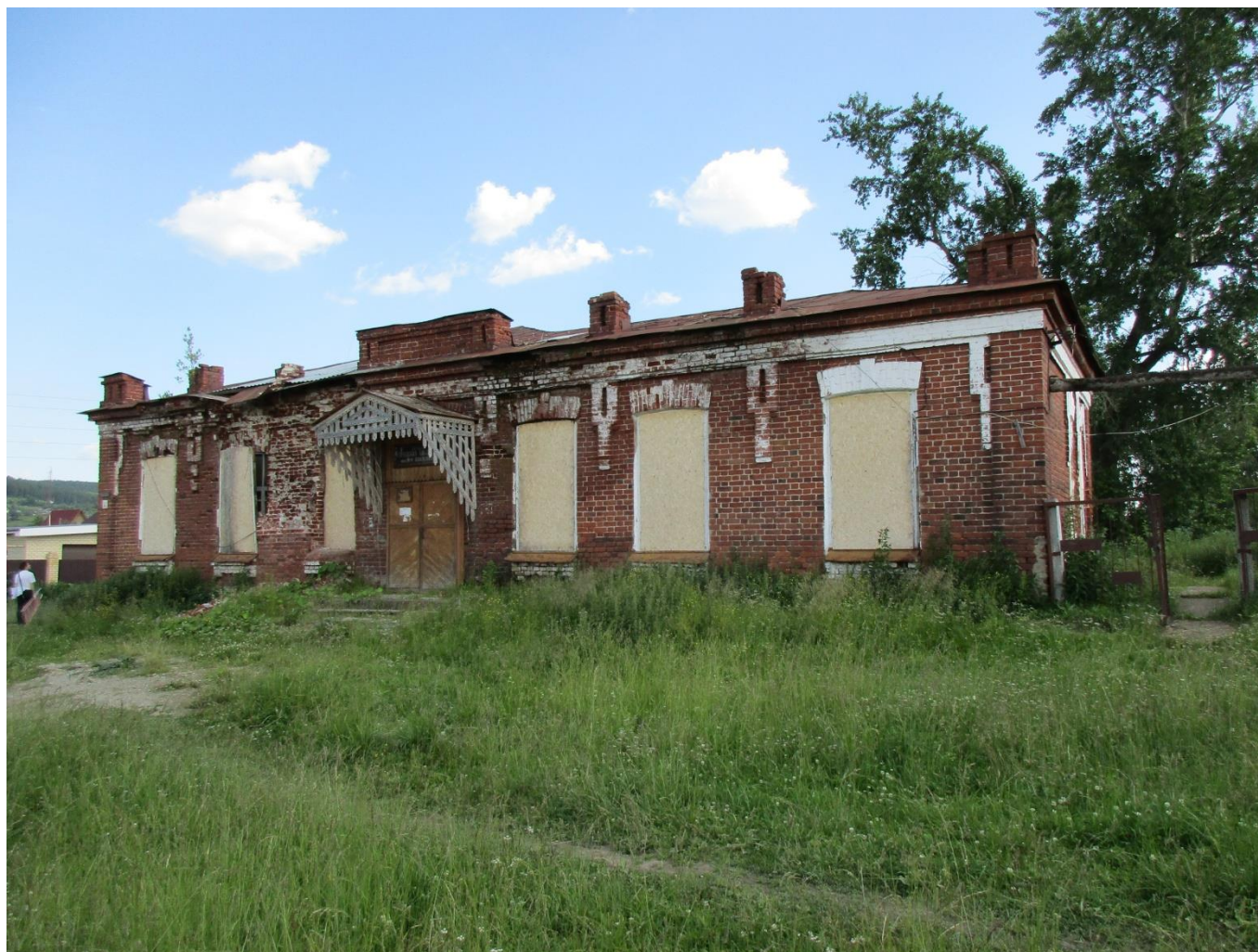
4. Здание земской школы в Верхнем Тагиле. Северный фасад. 16.07.2017