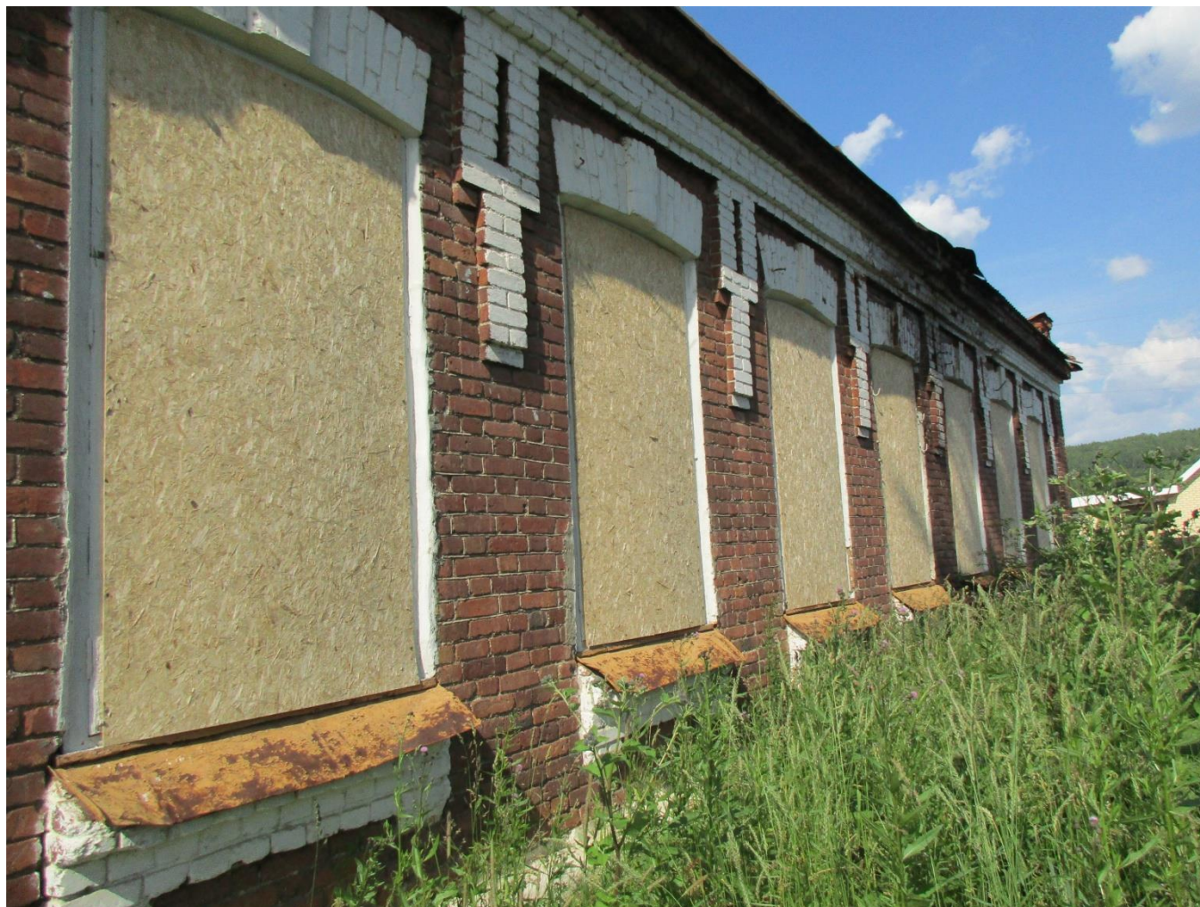
7. Здание земской школы в Верхнем Тагиле. Южный фасад. 16.07.2017