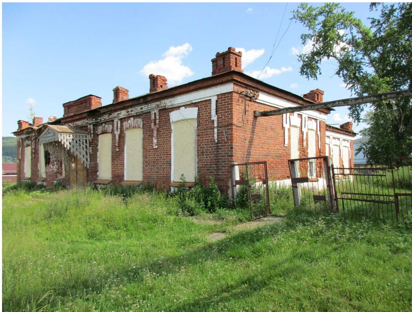
5. Здание земской школы в Верхнем Тагиле. Вид с северо-западной стороны. 16.07.2017