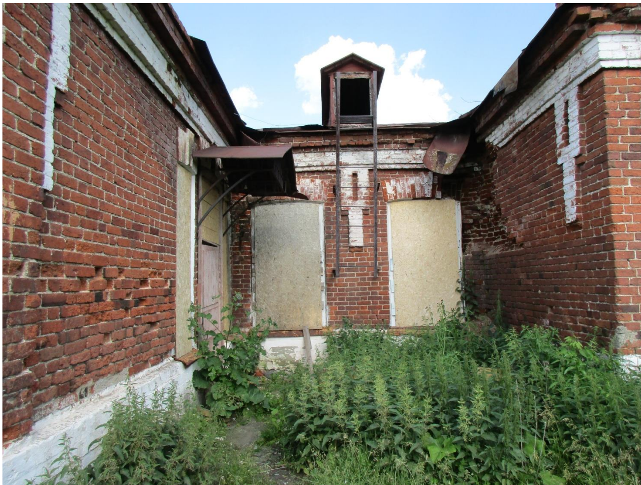
6. Здание земской школы в Верхнем Тагиле. Фрагмент западного фасада. 16.07.2017