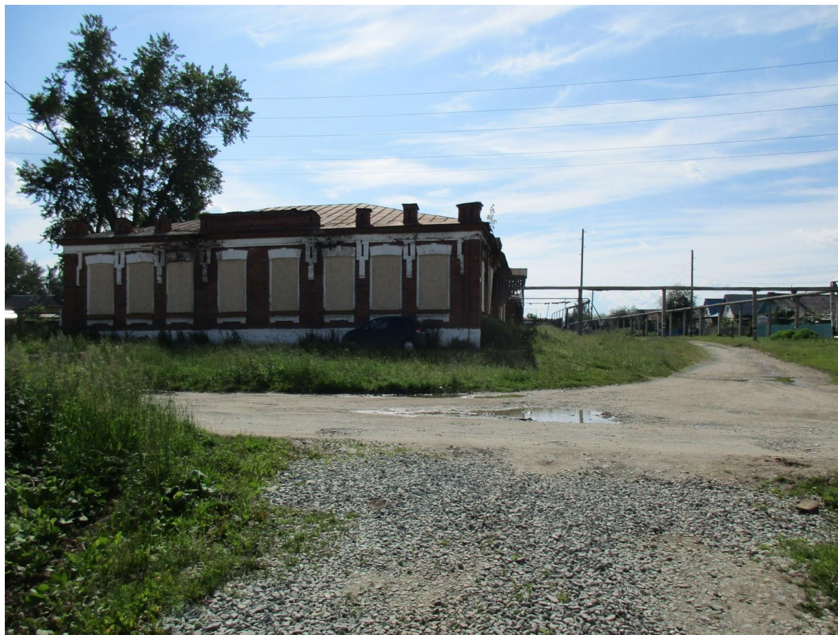
3. Вид здания земской школы со стороны ул. Чапаева в Верхнем Тагиле. 16.07.2017