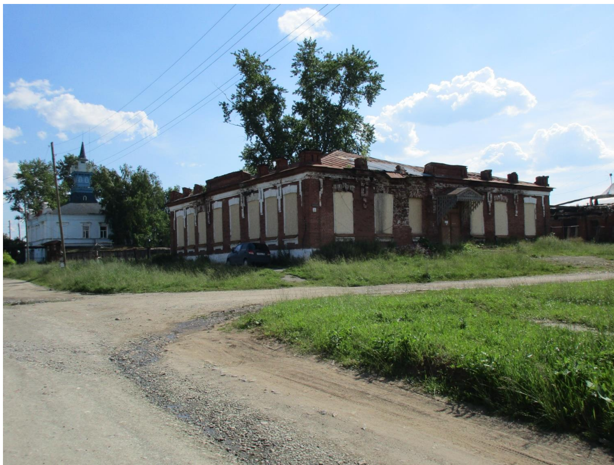
2. Общий вид здания земской школы со стороны перекрестка ул. Чапаева и Советской в Верхнем Тагиле. 16.07.2017.