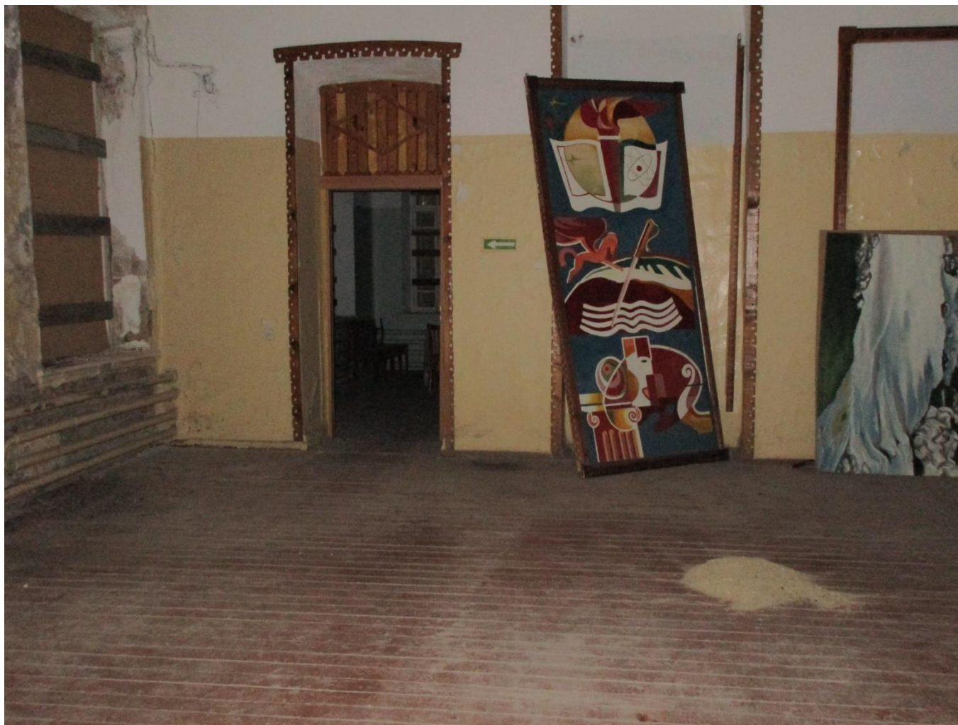
11. Интерьер здания земской школы в Верхнем Тагиле. 16.07.2017