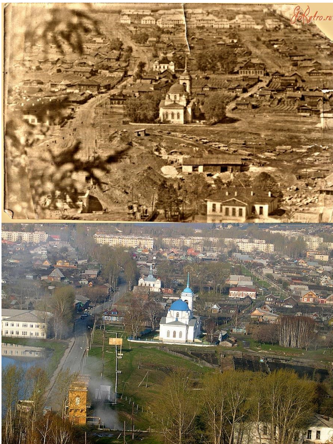
1. Вид на старую часть Верхнего Тагила со стороны «господского дома», который находится на возвышенности. Напротив Знаменской церкви – поляна, где находился железоделательный завод. За церковью на втором плане – здания волостного правления (слева) и земской школы (справа). Фото начала XX в. и совр. фото.