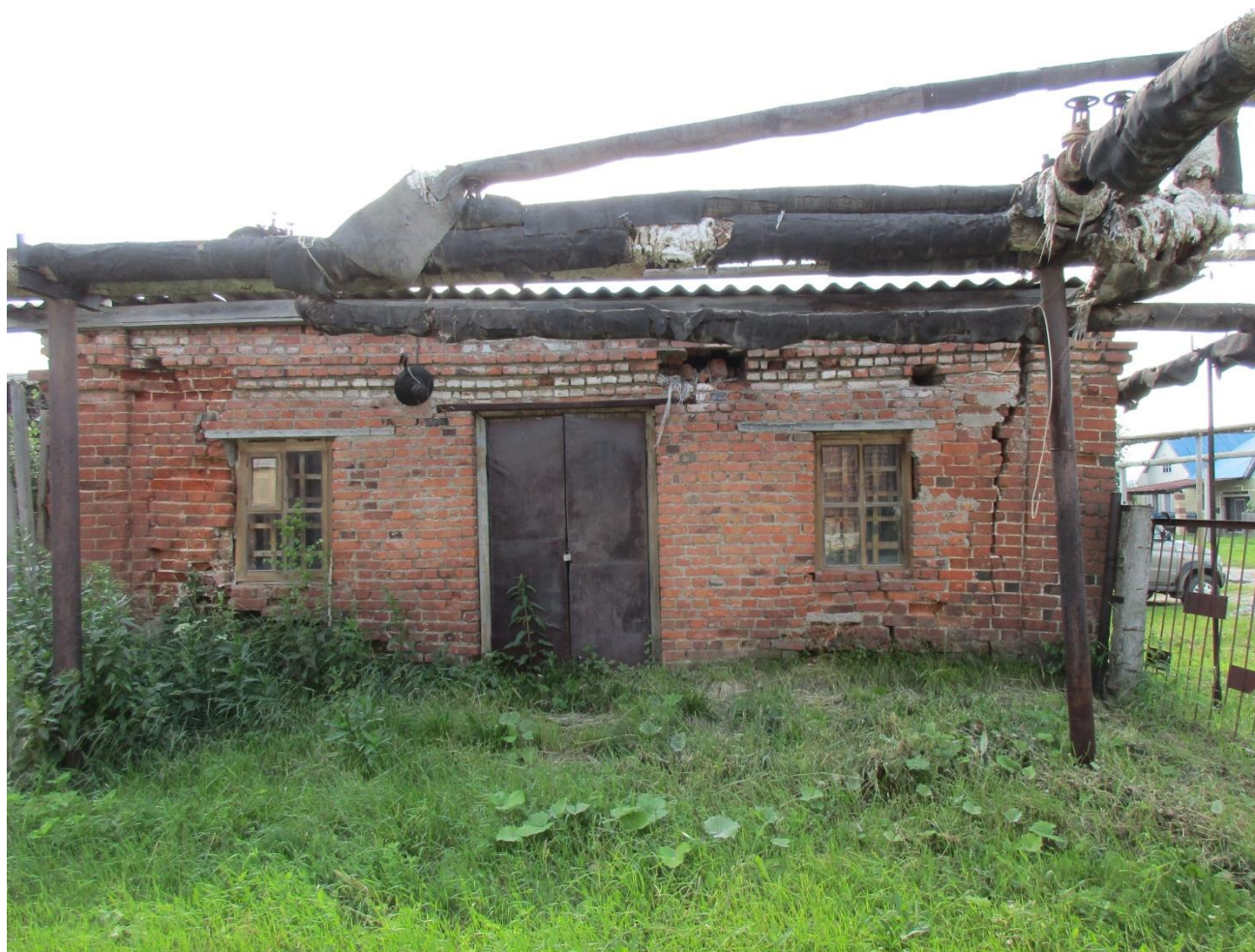
10. Флигель усадьбы здания земской школы в Верхнем Тагиле. 16.07.2017