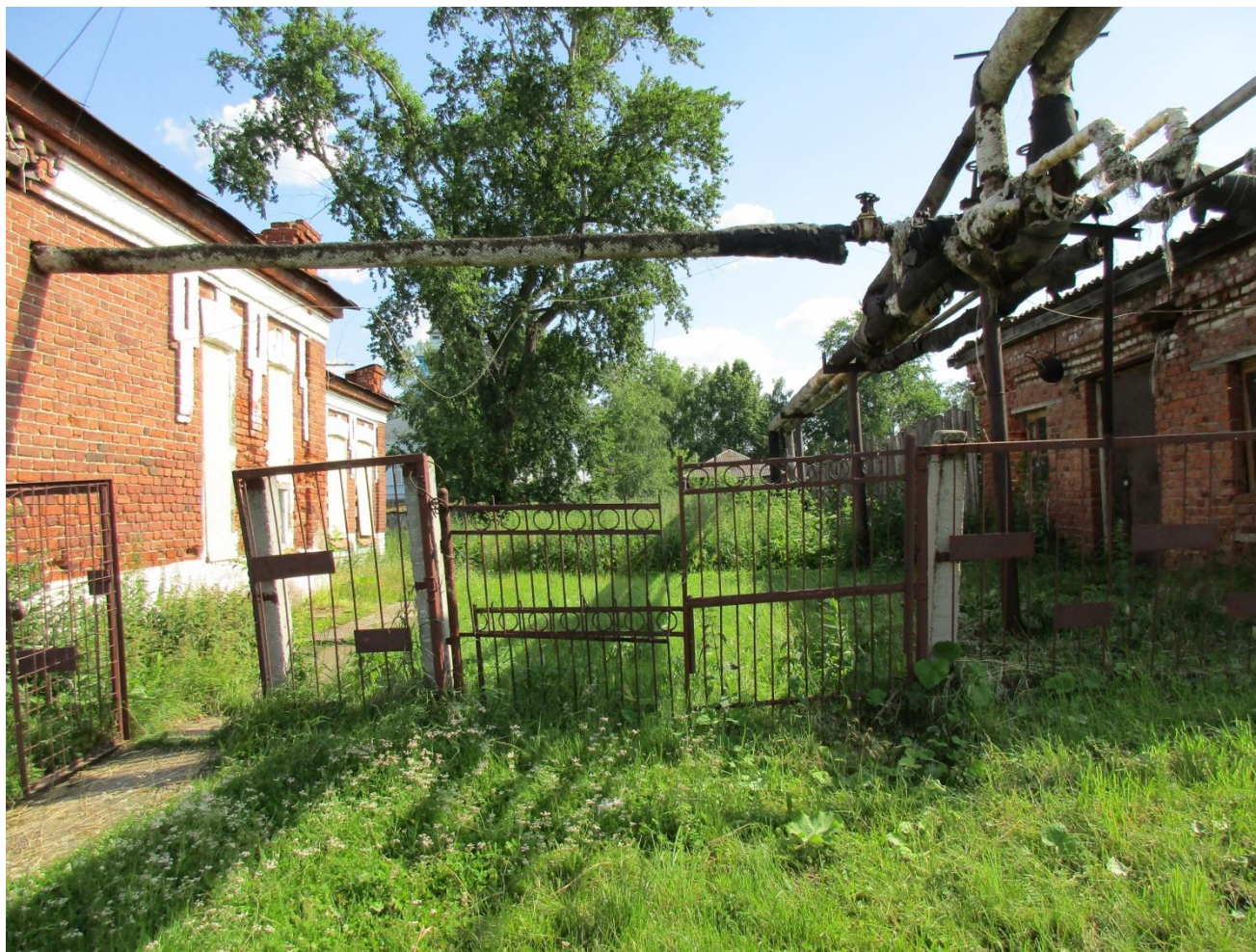
8. Вид на усадебный участок здания земской школы со стороны ул. Чапаева. 16.07.2017