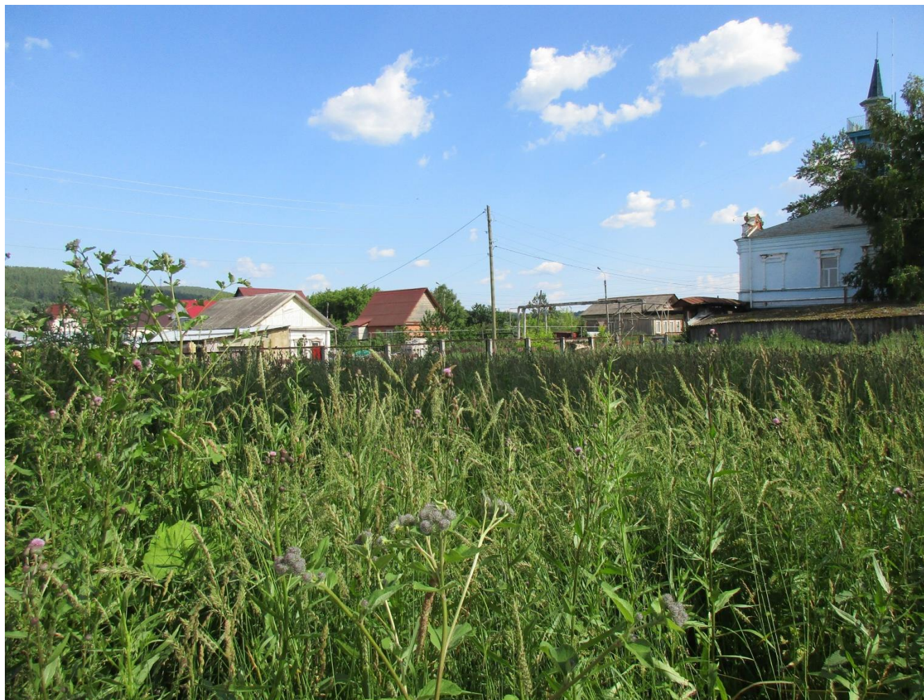
9. Вид на восточную сторону усадебной территории здания земской школы. 16.07.2017